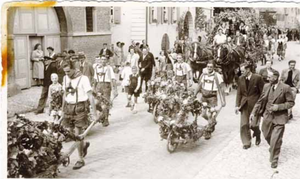
Mainstockheimer Kirchweih 1951