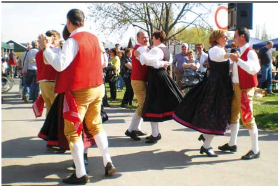
Die Volkstanzgruppe tritt natürlich auch wieder bei der diesjährigen Kirchweih auf. Hier ein Foto vom Fähr-Jubiläum 2010.